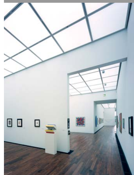
Tageslicht setzt die Kunstobjekte brillant in Szene.