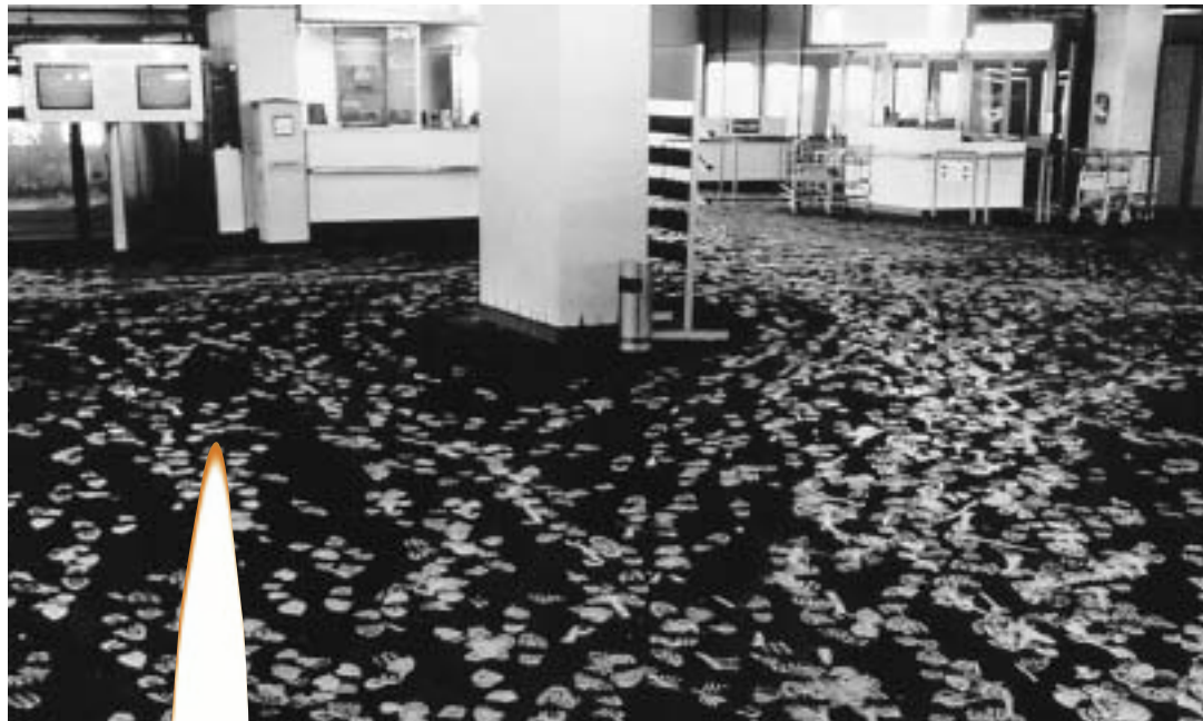
Der Brand des Flughafens Düsseldorf im April 1996 kostete 17 Menschen das Leben.

Fachverband Lichtkuppel, Lichtband und RWA e.V.